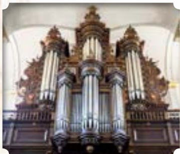
Kopenhagen - Denemarken Kerk: Helligåndskirken Bouwer: Marcussen & Søn Stijl: Frans-symfonisch