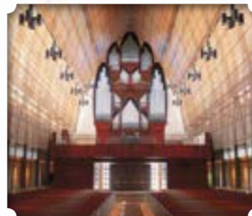
Miami - Verenigde Staten Kerk: Church of the Epiphany Bouwer: Ruffatti Stijl: Amerikaans-symfonisch