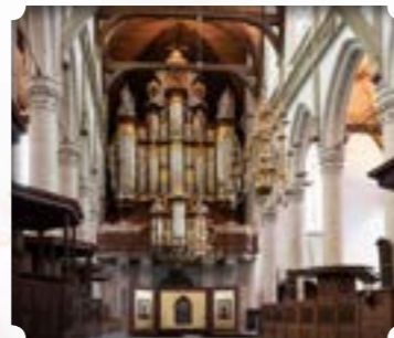
Amsterdam - Nederland Kerk: Oude kerk Bouwer: Vater-Müller Stijl: Nederlands-romantisch