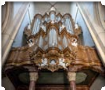
Kampen - Nederland Kerk: Bovenkerk Bouwer: Hinsz Stijl: Barok (Noord-Duits)