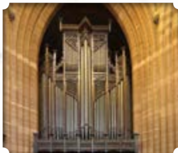
Liverpool - Verenigd Koninkrijk Kerk: Mossley Hill Church Bouwer: Willis & Sons Stijl: Engels-romantisch