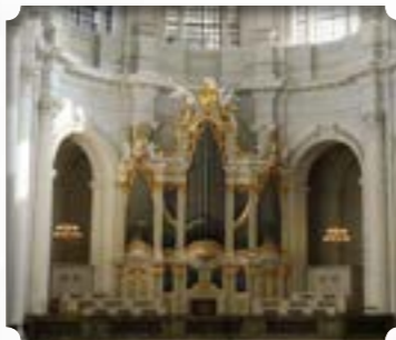
Dresden - Duitsland Kerk: Hofkirche Bouwer: Silbermann Stijl: Barok (Zuid-Duits)