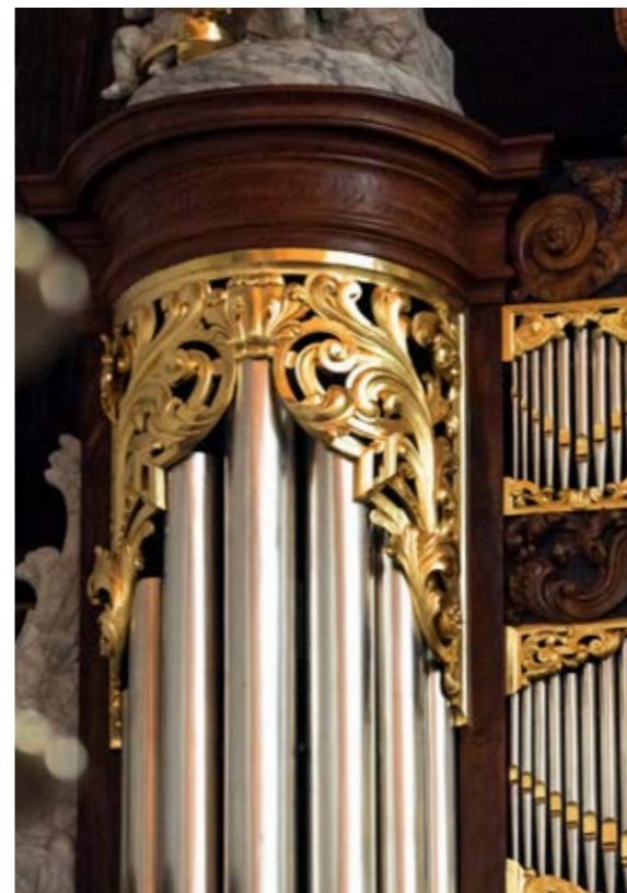
DE OUDE KERK

Oude Kerk. Een klein maar praktisch verschil is de registerindeling. De Monarke Amsterdam telt geen vier rijen van acht, maar acht rijen van vier registers. Dat brengt ook de buitenste registers binnen handbereik van de organist. Daarmee biedt dit orgel het ultieme compromis tussen authenticiteit en optimaal gebruiksgemak.